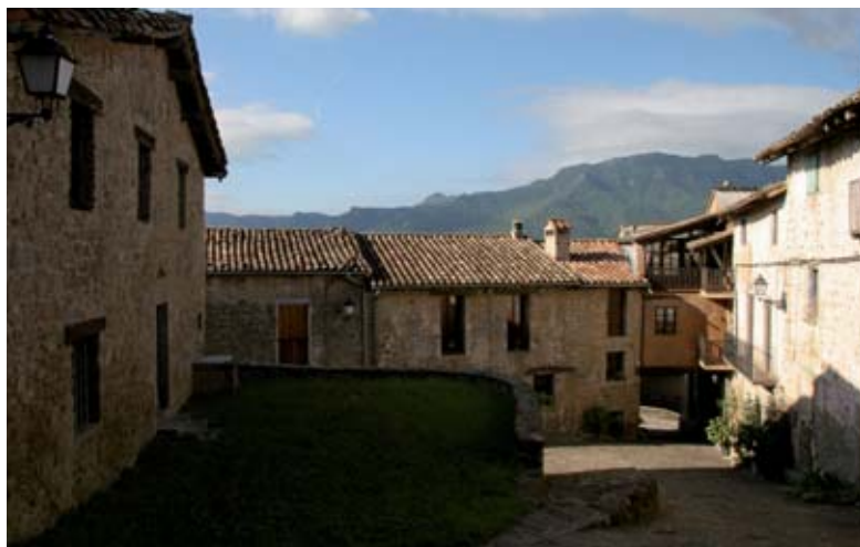
El núcleo del Mallol

En Sant Feliu de Pallerols , la siguiente parada de nuestra ruta, también existe un recuerdo al líder remensa. Os tendréis que dirigir al núcleo antiguo (la antigua sagrera) donde encontraréis la casa donde murió Francesc de Verntallat. De este conjunto arquitectónico también podéis visitar el molino de la Conqueta, donde trabajaban sin descanso los campesinos remensas que decidieron sublevarse contra las imposiciones abusivas de los señores feudales. Dentro del término municipal de Sant Feliu de Pallerols se alza el Castillo de Hostoles , la principal fortificación del valle y uno de los principales focos del feudalismo. Francesc de Verntallat convirtió el castillo –hoy en ruinas– en el cuartel general durante la primera revuelta de los campesinos y, de hecho, continuó en manos de los remensas hasta después de la Sentencia Arbitral de Guadalupe. De la efervescencia de este pasado quedan los restos de la muralla, parte de la torre maestra cilíndrica y la cisterna de este símbolo de la historia del valle y de Cataluña, que está documentado ya el año 1020.