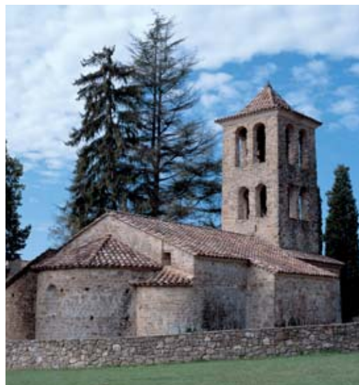
Sant Martí de Capsec

Si vous décidez d'effectuer le circuit à la mi-février vous pourrez ajouter une nouvelle attraction à cet itinéraire. Il s'agit de la foire du Farro qui est organisée à la Vall de Bianya durant ces dates. Vous pourrez découvrir et goûter l'un des ingrédients les plus typiques de la région.