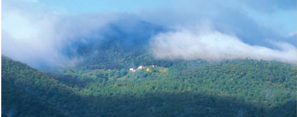
Les brumes se dissipent à la Vall de Bianya après une averse