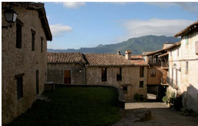
El nucli d'El Mallol

A Sant Feliu de Pallerols , la parada següent de la nostra ruta, també existeix un record al cabdill remença. Us heu de dirigir al nucli antic (l'antiga sagrera) on trobareu la casa on va morir Francesc de Vernallat. D'aquest conjunt arquitectònic també podeu visitar el molí de la Conqueta, on treballaven sense descans els pagesos remences que van decidir revoltar-se contra els imposicions abusives dels senyors feudals. Dins el terme municipal de Sant Feliu de Pallerols s'alça el Castell d'Hostoles , la principal fortificació de la vall i un dels principals focus del feudalisme. Francesc de Vernallat va convertir el castell –avui en runes– en el quarter general durant la primera revolta dels pagesos i, de fet, continuà a mans dels remences fins després de la Sentència arbitral de Guadalupe. De l'efervescència d'aquest passat, en queden les restes de la muralla, part de la torre mestra cilíndrica i la cisterna d'aquest símbol de la història de la vall i de Catalunya, que ja està documentat l'any 1020.